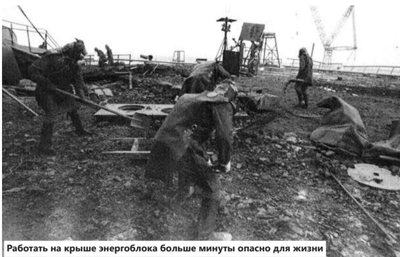
Работать на крыше энергоблока больше минуты опасно для жизни