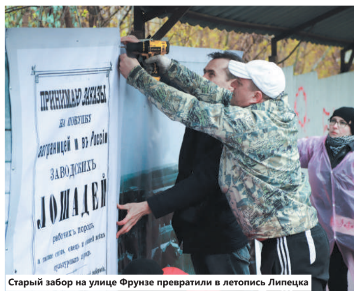
Старый забор на улице Фрунзе превратили в летопись Липецка