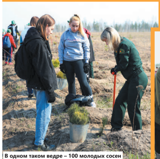
В одном таком ведре – 100 молодых сосен