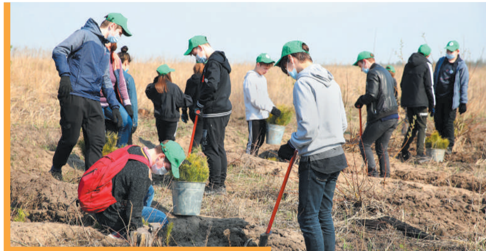
За один день школьники посадили 2 га леса